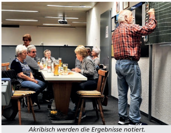
Akribisch werden die Ergebnisse notiert.

Wir sind eine flotte, lustige Truppe und haben