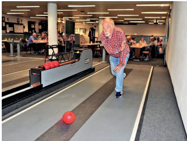
Mit voller Konzentration wird die Kugel auf den Weg geschickt.

Die Pandemie hatte auch der „Flotten Kugel“ einen Strich durch die Rechnung gemacht, da auch die Kegelbahnen unter die Beschränkungen fielen, war die Gruppe zu einer Zwangspause gezwungen. Nach langer Pause durfte die Kegelgruppe der BSHM Ende 2021 wieder aktiv werden.